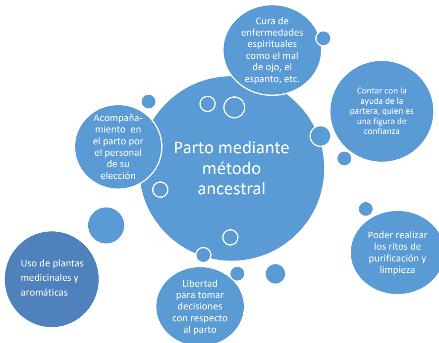
Figura. 1. Elementos que influyen con mayor fuerza en la preferencia por los métodos ancestrales de parto y cuidado materno.

Con el fin de determinar los factores que inciden en la preferencia de las mujeres indígenas sobre el parto domiciliario se aplica una serie de encuestas y entrevistas a las parturientas y parteras seleccionadas. Tras agrupar y clasificar toda la información obtenida, finalmente se obtienen un conjunto de elementos que a juicio de las madres y parteras estudiadas son los que influyen con mayor fuerza en la preferencia por los métodos ancestrales de parto y cuidado materno de las mujeres de esta comunidad. Los datos obtenidos se agrupan en la Figura 1.