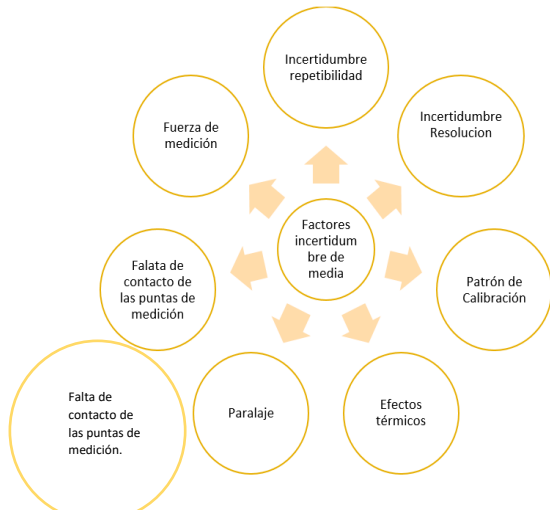
Figura 5 Factores de incertidumbre que intervienen en el proceso de calibración del micrómetro, creación propia.

Derivado de la experimentación se evalúa el proceso con el balance de incertidumbre (tabla 1), con el cual se indica la confiabilidad de la calibración, tomando en cuenta el aporte científico de cada una de las fuentes de incertidumbre de medida (figura 5), que influyen para el micrómetro de alcance exterior (Summers, 2006).