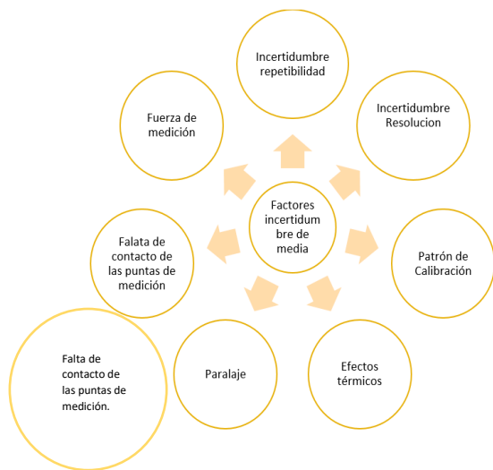
Figura 5 Factores de incertidumbre que intervienen en el proceso de calibración del micrómetro, creación propia.