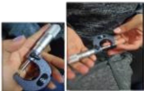
Figura 6 Micrómetros de alcance exterior del Laboratorio de Mediciones de Ingeniería, Centro Universitario Valle de México UAEM, creación propia.

En relación con lo expuesto se adopta la tecnología de Quick Respons code (QR) para lograr una reingeniería (Carrasco, 2009) de la gestión del uso del Laboratorio de Mediciones de Ingeniería, con información del registro del alumno y encuestas de satisfacción en un servidor local (actualmente se utiliza un servidor en la nube de formularios Google) y controlar el proceso de calibración con el balance de incertidumbre, que permiten mejorar el proceso, la satisfacción de los alumnos y profesores, así como también, la confiabilidad de la calibración del micrómetro con base a la norma ISO 9001-2015 y NMX-EC-17025- IMNC-2006 (Lindsay, 2008) en el Laboratorio de Mediciones de Ingeniería del CU Valle de México de la UAEM. (IMNC Instituto Mexicano de Nomarlización y Confiabilidad A.C, ISO, IEC., 2006).